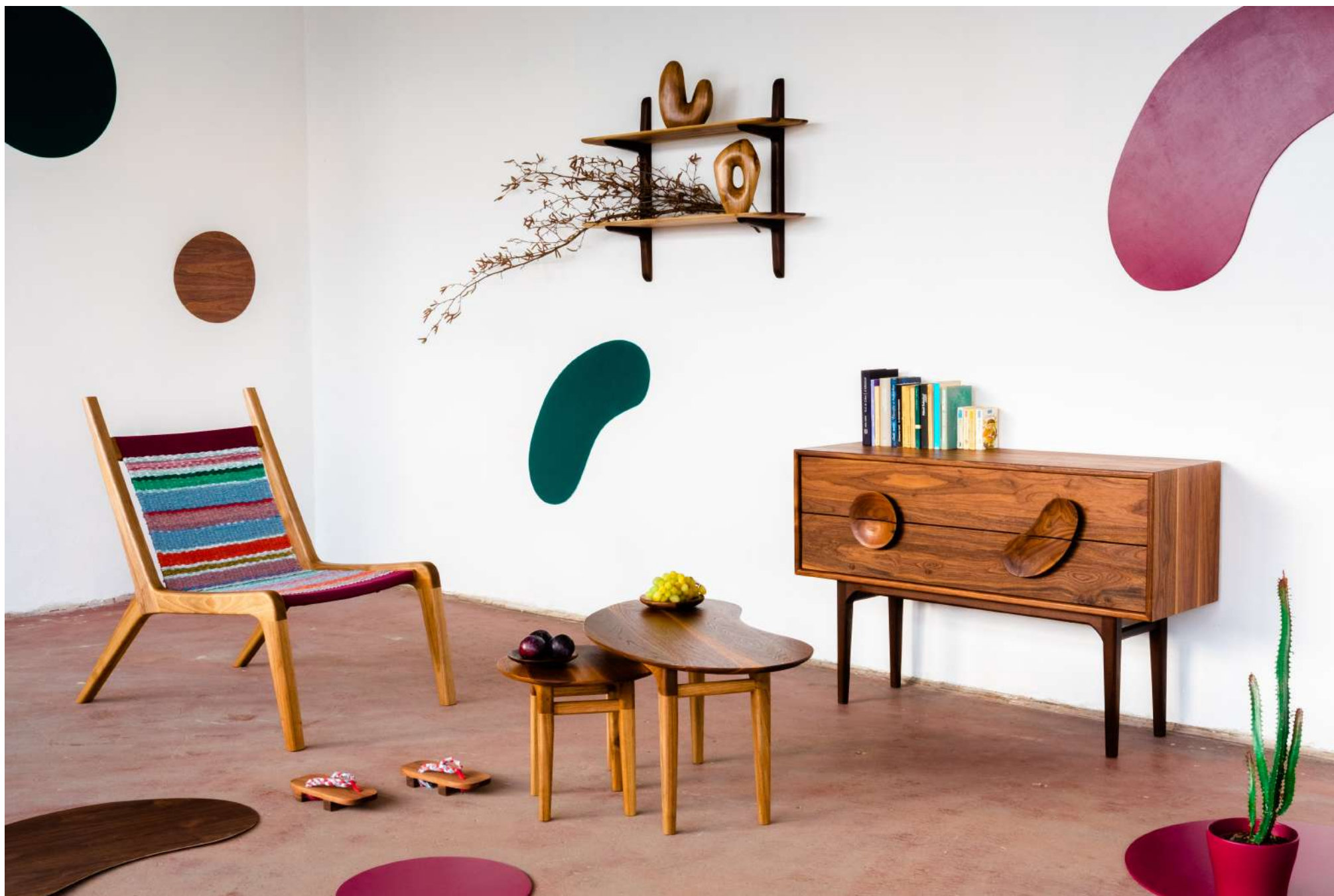
A Kozma Lajos Kézműves Iparművészeti Ösztöndíj támogatásával készült diófa bútorcsalád, 2021.